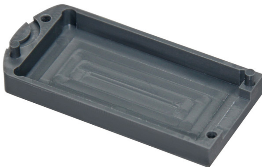
Pièce fraisée pvc Télécharger le fichier FPD