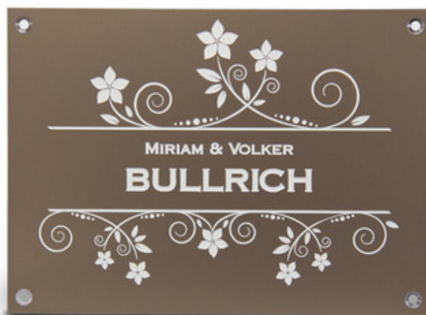
Plaque de porte