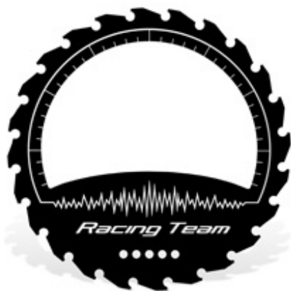
Contour libre Télécharger le fichier FPD