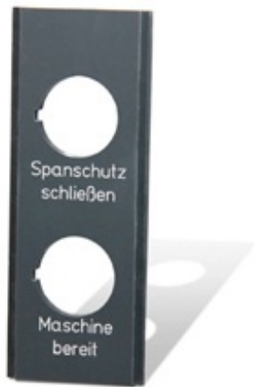
PVC Frontplatte FPD-Datei Download