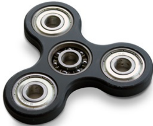
Fidget Spinner FPD-Datei Download